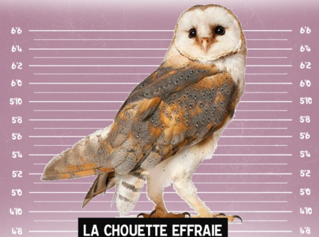
LA CHOUETTE EFFRAIE

LA VILLE DE CHAVAGNE RECHERCHE CET INDIVIDU !